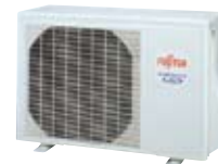
ASYA24L - ASYA30L