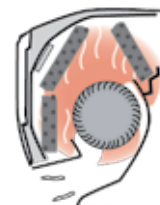
ca. 50 min tørketid